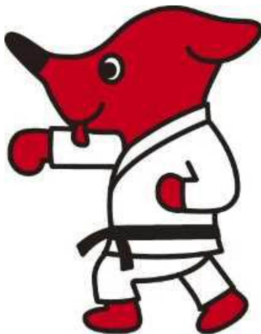
千葉県PR マスコットキャラクター チーバくん